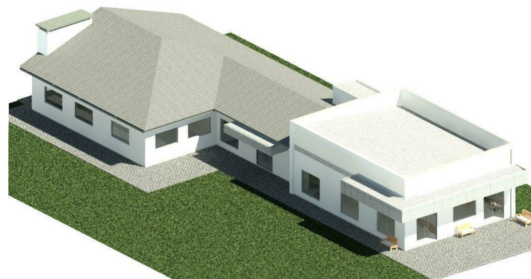
3 -3D- 3 1 : 1