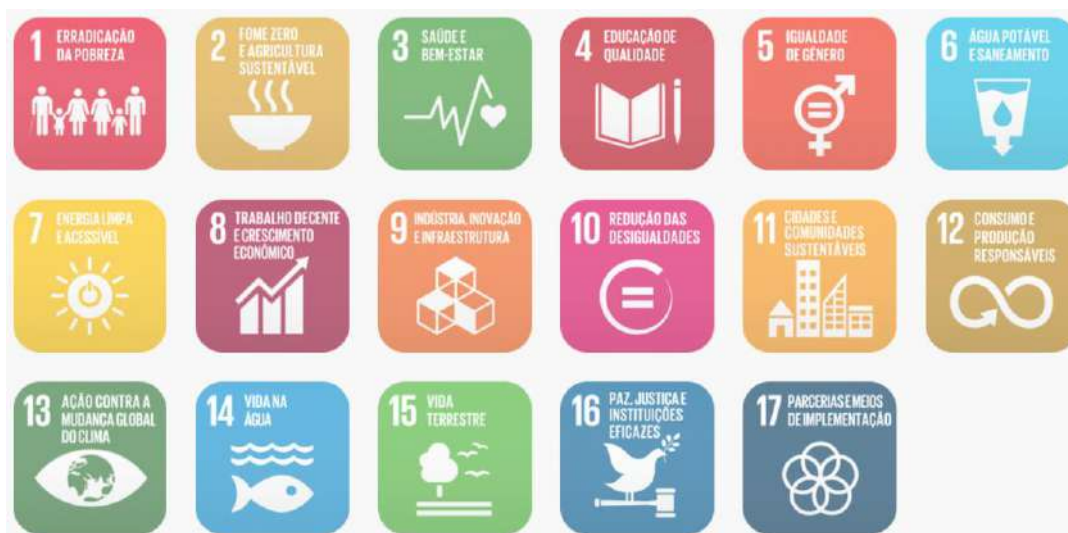
Figura 02: Objetivos de Desenvolvimento Sustentável