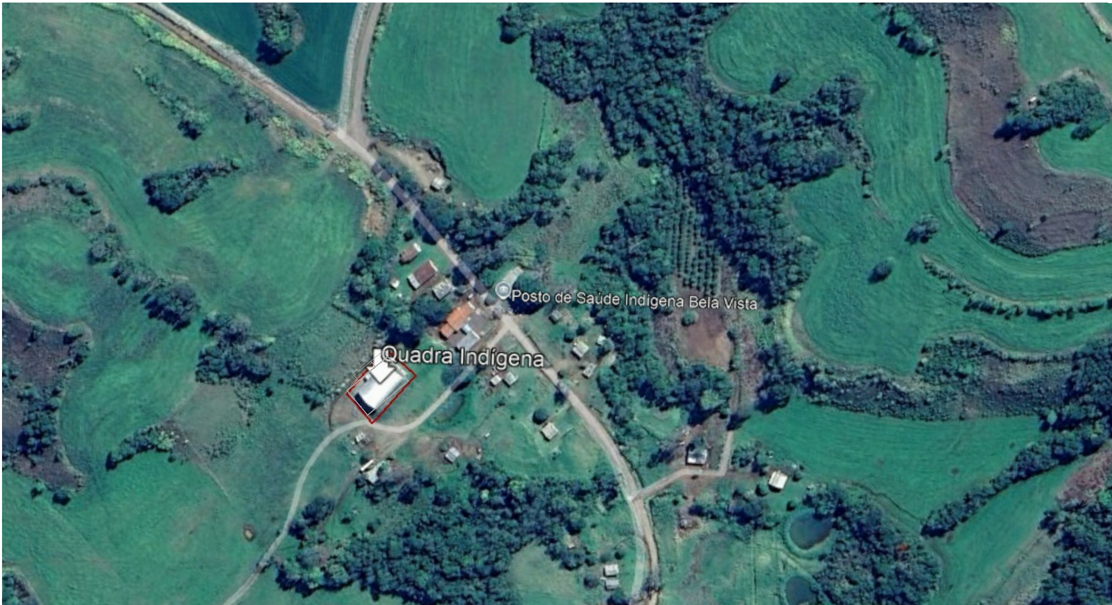
1 Imagem Aérea 1 : 2000